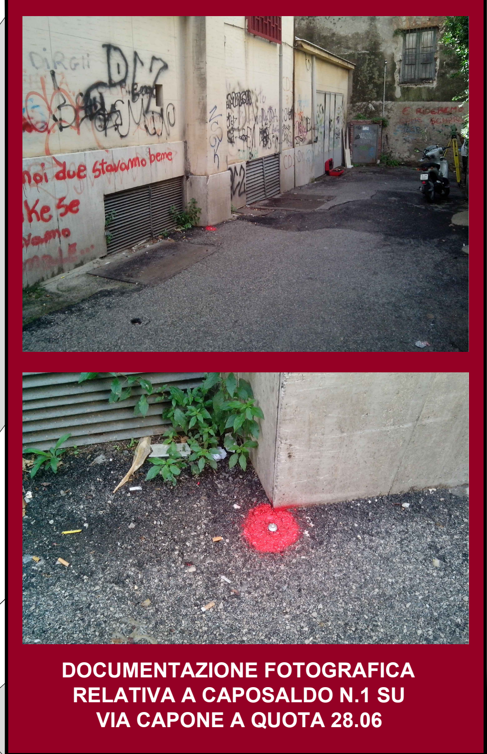
DOCUMENTAZIONE FOTOGRAFICA RELATIVA A CAPOSALDO N.1 SU VIA CAPONE A QUOTA 28.06